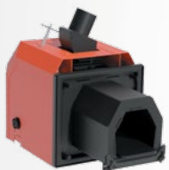
Palnik serii FIREBLAST z automatycznym czyszczeniem