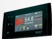
Dotykowy regulator kotłowy ESTYMA TOUCH w standardzie