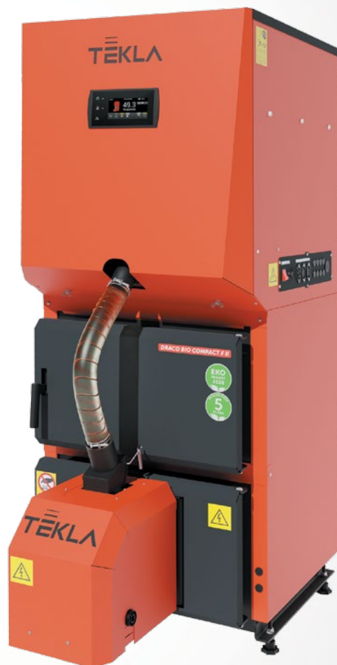
ZDJĘCIA ZAWARTE W KATALOGU MAJĄ CHARAKTER WYŁĄCZNIE INFORMACYJNY. PREZENTOWANY MODEL KOTŁA DRACO BIO COMPACT FII 12

Draco Bio Compact F II jest kotłem automatycznym do spalania biomasy w postaci peletu o średnicy 6 mm. Zbiornik paliwa umieszczony w górnej części kotła pozwala na zminimalizowanie jego wymiarów zewnętrznych co znacznie ułatwia montaż nawet w małych kotłowniach. Niewielka wysokość kotła sprawia, że załadunek paliwa nie jest uciążliwy dla użytkownika. W celu powiększenia pojemności zbiornika paliwa do każdego kotła dołączona jest tzw. nadstawka dzięki której zbiornik zwiększa swoją pojemność o 90 l. Zastosowany palnik Fireblast II z ruchomym rusztem oraz zaawansowany sterownik ESTYMA IGNEO TOUCH z kolorowym, dotykowym wyświetlaczem, zapewnia wysoki komfort użytkownika kotła ograniczając jego obsługę do niezbędnego minimum.